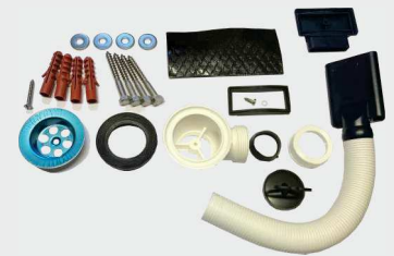
Serienzubehör bei Ausstattung mit Überlauf