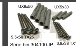
Serie bei 304100-IP 3,9x38 TX15 Prof-Mauerbefestigung