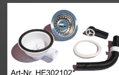
Art-Nr. HE302102 Verschleißbares Siebventil (Überlaufbohrung bauseits erforderlich)