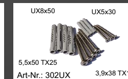
UX8x50 UX5x30 5,5x50 TX25 3,9x38 TX15 Art-Nr.: 302UX Prof-Mauerbefestigung